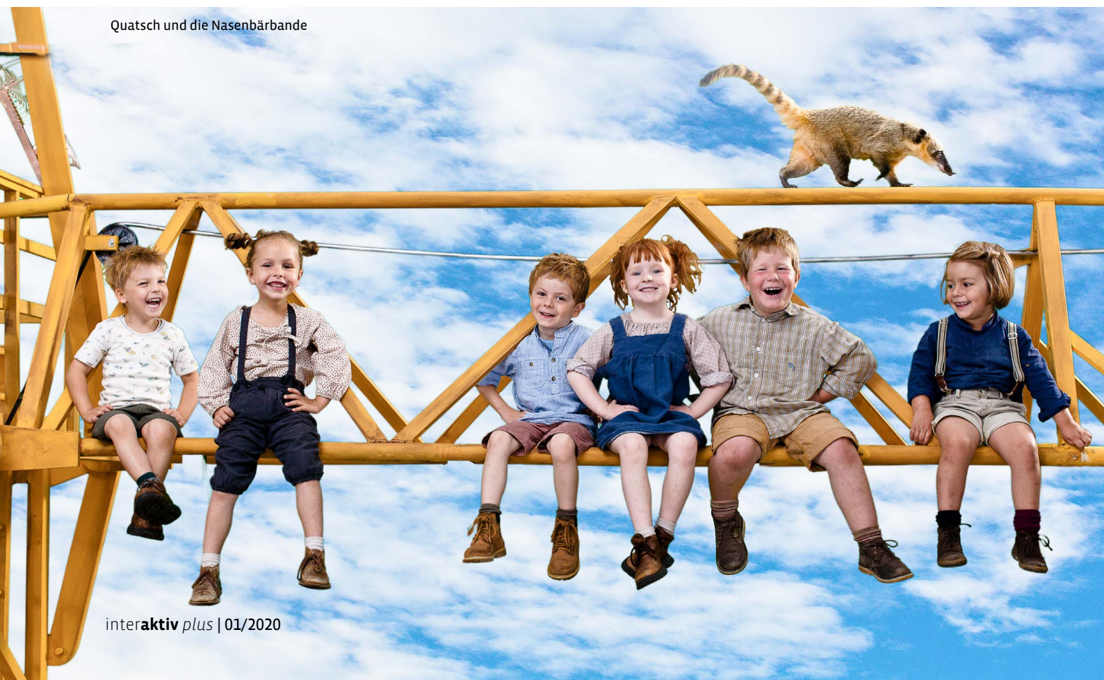
Quatsch und die Nasenbärbande